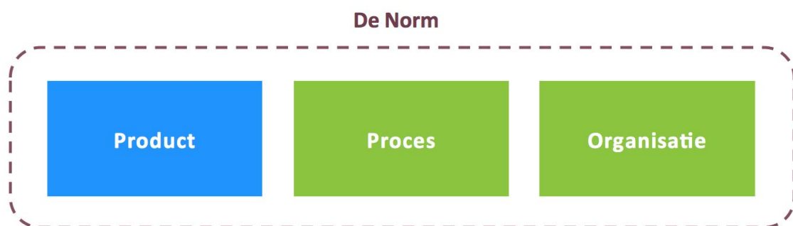
Figuur 1: de norm onder de drie routes naar valide exameninstrumenten

Deze notitie is gericht op deel 2 en 3: de proces- en organisatie-eisen. De producteisen zijn in een aparte publicatie opgenomen.